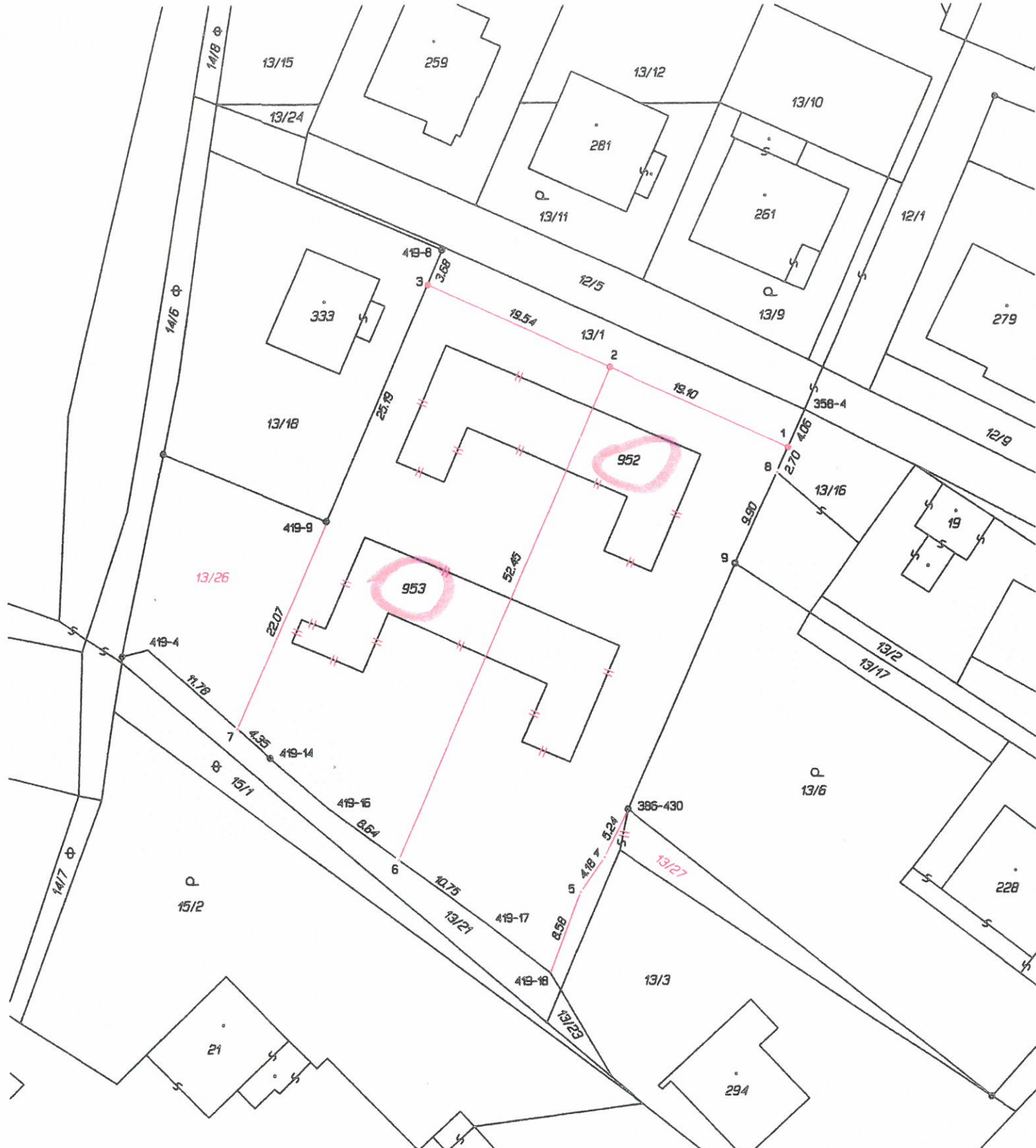
Seznam souřadnic (S-JTSK) Črta bodů Souřadnice pro zepř. do KN Y X Kód kv. Poznámka k.o. Mladějov v Čechách (696897)