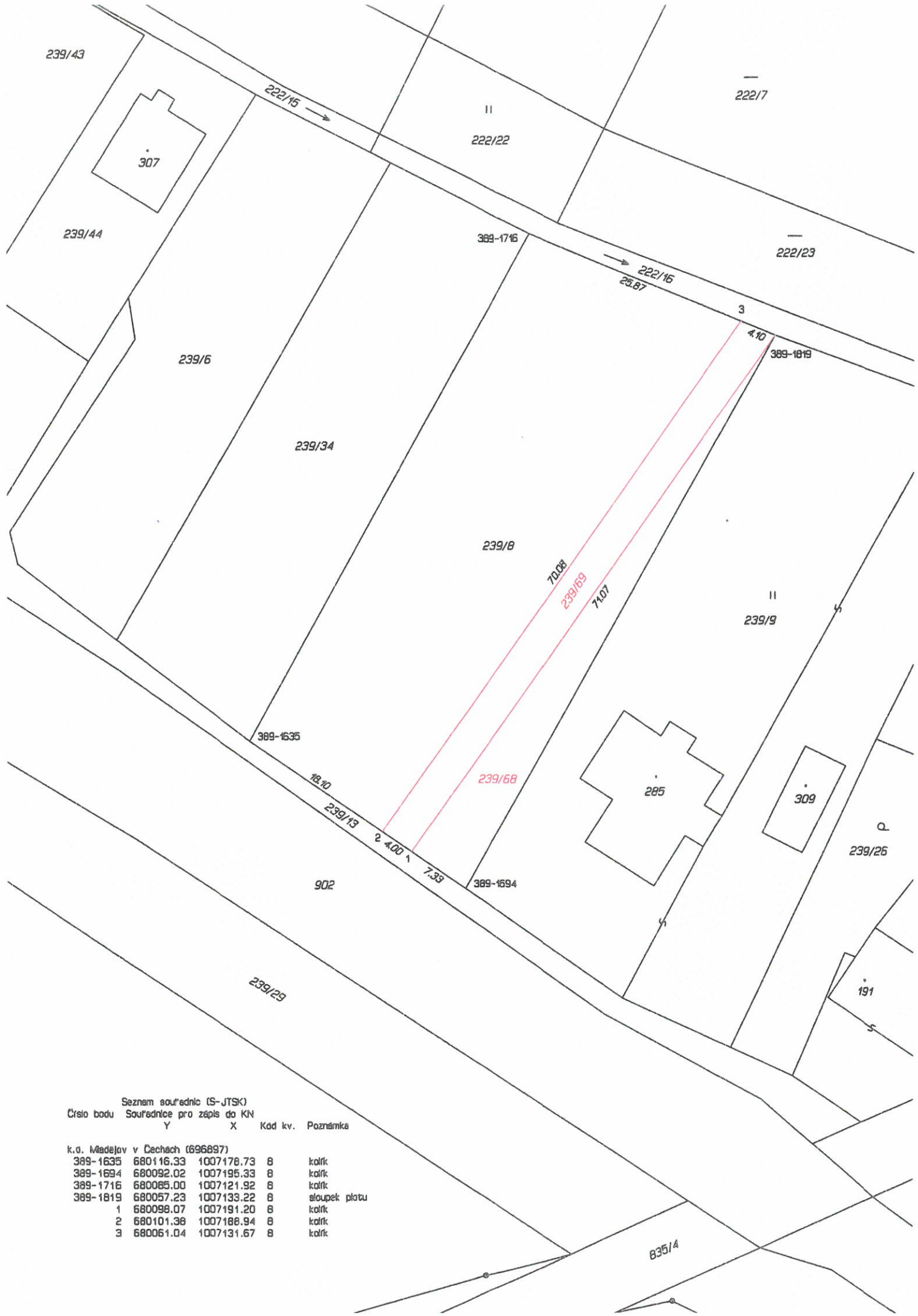
Seznam souřadnic (S-JTSK) Číslo bodu Souřadnice pro zápis do KN Y X Kod kv. Poznámka