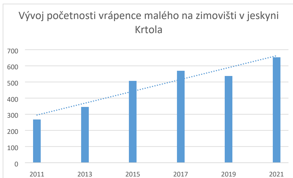
Graf č. 2: Vývoj početnosti populace vrápence malého