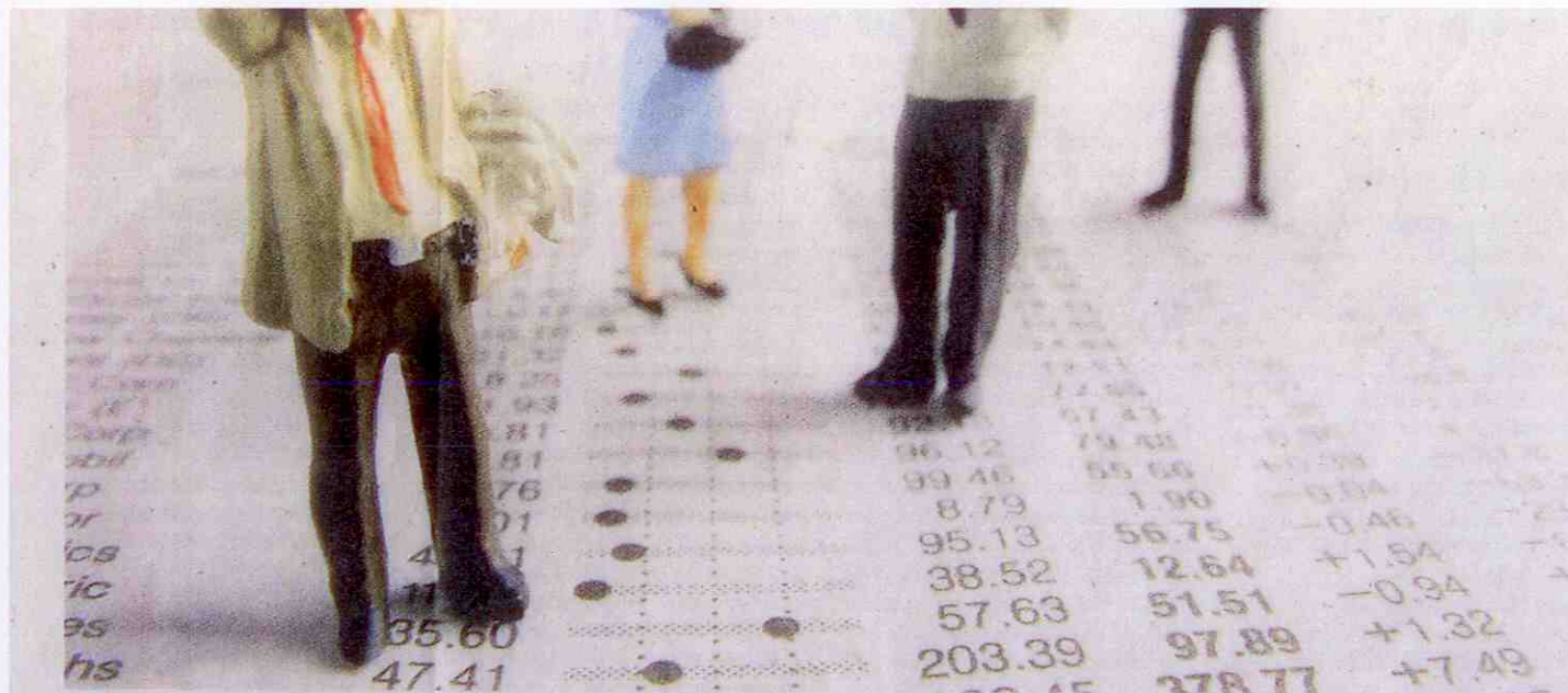
Kolik je seniorů? Data ze sčítání slouží také k plánování kapacit domovů pro seniory, nemocnic a sociálních zařízení.