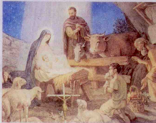
Betlém Biblické narození Ježíše by se odehrálo v Nazaretě, kdyby Josef s Marií nemuseli putovat do svého trvalého bydliště.

Při sčítání lidu v roce 1890 vznikla v tehdejší měšťanské pivovaru v Českých Budějovicích nepříjemná situace. Šéfové pivovaru naléhali na zaměstnance, aby se přihlásili k německé národnosti a k mateřskému německému jazyku. Převážně čeští zaměstnanci však začali klást velmi silný odpor, který vyvrcholil tím, že je vedení měšťanského pivovaru vyzvalo, ať si založí pivovar vlastní, když se nechtějí podvolit. Češi tedy uposlechli a v létě 1894 se začaly upisovat první akcie nově vznikajícího budějovického Budvaru, který o dva roky později zahájil produkci.