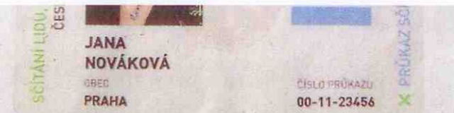
Vzor Tak vypadá originální průkaz sčítacího komisaře.